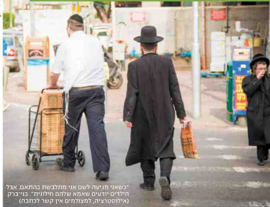
"כשאני מגיעה לשם אני מתלבשת בהתאם, אבל הילדים יודעים שאמא שלהם חילונית". בני ברק (אילוסטרציה, למצולמים אין קשר לכתבה)