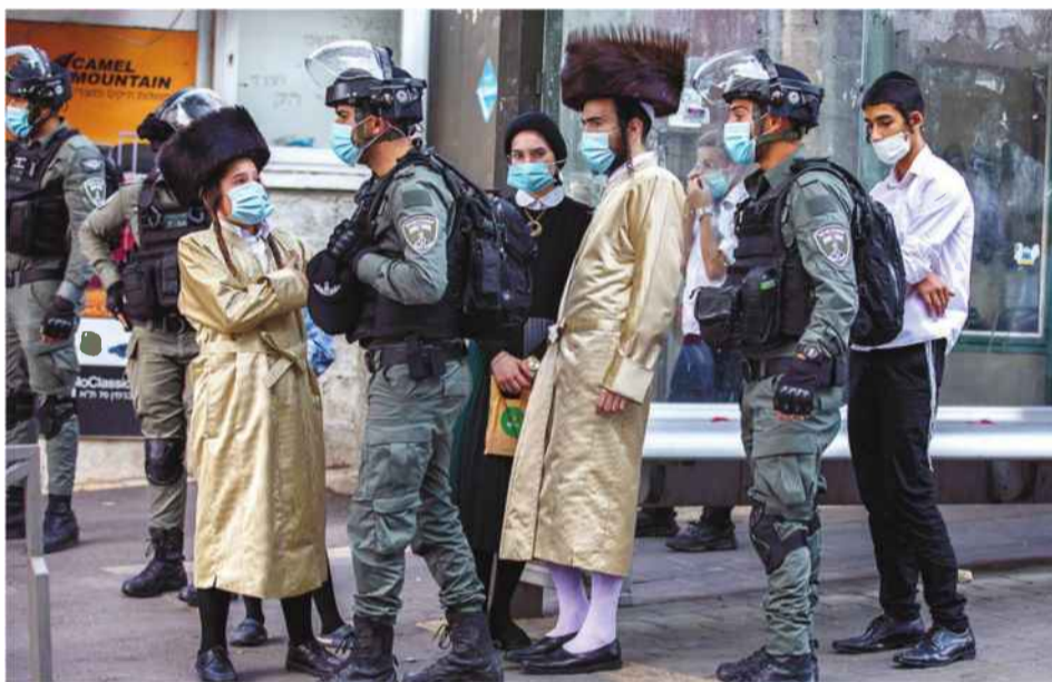
שכונת מאה שערים בירושלים, השבוע. אורח החיים החרדי אינו קוסם יותר.

שנית, הממצאים של רגב וגורדון מלמדים על הקשר ההדוק בין תמריצים כלכליים לבין הבחירה באורח החיים החרדי. אלפים הצטרפו לחברה החרדית כשרשת מעיין החינוך התורני העניקה לילדיהם שירות מפנק, ואלפים עוזבים את החברה החרדית לאחר שהקצבאות קוצצו והמצוקה הכלכלית גברה. נזכיר שוב כי המדינה בתוך מדינה של החרדים מתקיימת בזכות כספי המסים של הישראלים הערבים – כלומר החילונים והדתניים. אם הרוב העובד ומשלם המסים יפסיק לממן את האוטונומיה החרדית, ויפסיק לקבל בהכנעה את הסירוב החרדי ללמוד ליבה, לשרת בצבא, לעבוד או לציית להוראות הקורונה – גם החרדים יאלצו כנראה להשתנות. שלישי, כל הממצאים הללו הם טרום הקורונה. במידה רבה, המגפה החריפה את המגמות בתוך החברה החרדית: הרבנים התבררו כטועים בעוד שהמדע צדק, ההנהגה החרדית העדיפה את הצייתנות לה על פני חיי חסידיה, ורבבות נערים ונערות נותרו מחוץ ללימודים והחלו להתחבר למחשב, לזום ולרשתות החברתיות. בהחלט ייתכן שהשבר של הקורונה רק יאיץ את מגמת האכזבה מאורח החיים החרדי, או לכל הפחות את האכזבה מההנהגה החרדית, כך שהשינוי בתוך החברה הזו יכול לקבל תנופה.